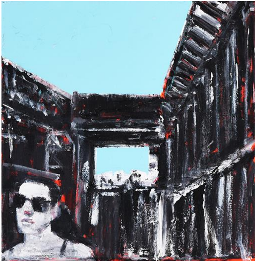
Das Bild zeigt ein Gemälde von Barbara Kirsch mit dem Titel Sold Skies. Es zeigt ein Porträt mit Sonnenbrille vor einer Architekturfassade.