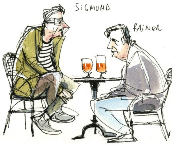
Sigmund und Rainer am Tisch beim Bier. Zeichnung von Nicola Maier-Reimer.

So erzeugen wir maximalen Ausdruck und Komik, und finden einen Weg, Menschen in Aktion zu zeichnen.