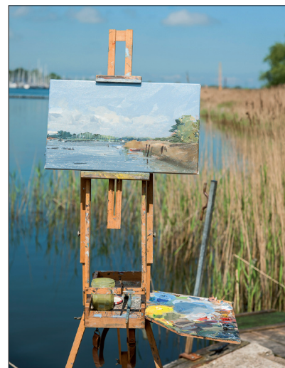
Natur und Kunst – die sommerliche Schlei-Akademie bietet viele Freiräume.