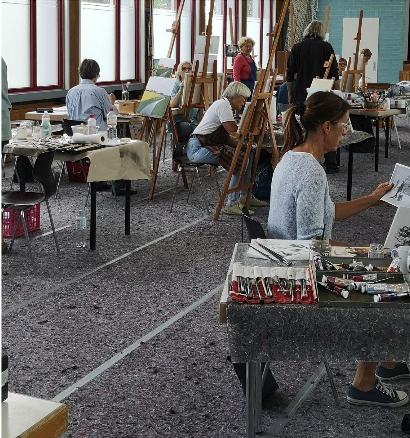
Ein Blick in das Großraum-Atelier an der Schlei-Akademie. Hier wird mit bis zu 26 Leuten gearbeitet.