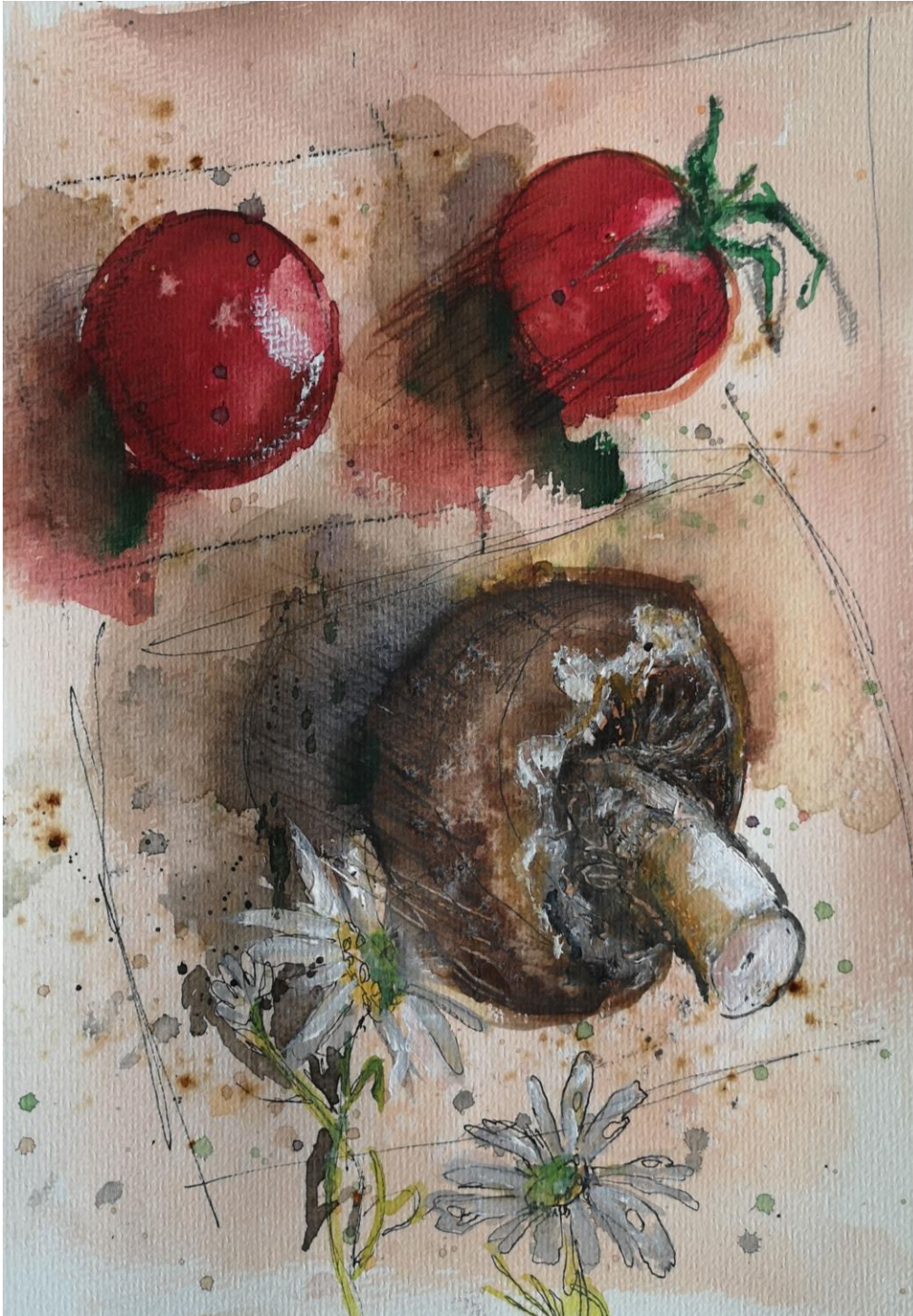
Das Foto zeigt ein Aquarell aus dem Kurs von Sven Brauer an der Schlei-Akademie 2020