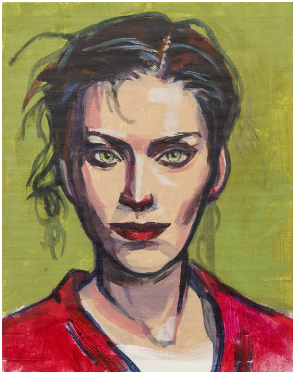
Das Gemälde von Conny Himme zeigt ein Porträt mit dem Titel „Grüne Augen“.

Alle Teilnehmenden werden individuell bei ihren Schritten begleitet. Besprechungen der Bilder finden einzeln und in der Gruppe statt.